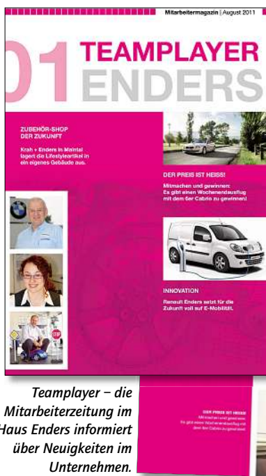
Teamplayer – die Mitarbeiterzeitung im Haus Enders informiert über Neuigkeiten im Unternehmen.

Enders ist offen für neue Themen und scheut sich nicht davor, Dinge umzustellen. Einige Beispiele sind die einheitliche Fahrzeugrücknahme von allen Leasingfahrzeugen über die Dekra, die Ölpreisgestaltung, Festgeldanlagen oder entsprechende Bestandsablösungen bei der Herstellerbank. Zudem hat er eine Eigengarantie eingeführt und das Reifenlager vergrößert.