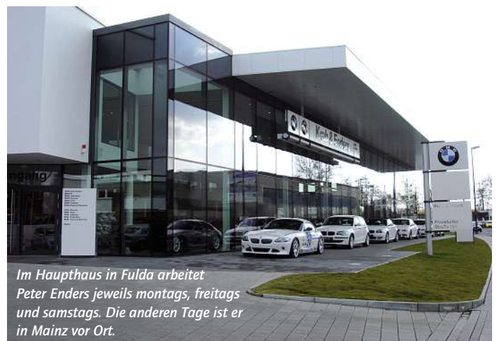
Im Haupthaus in Fulda arbeitet Peter Enders jeweils montags, freitags und samstags. Die anderen Tage ist er in Mainz vor Ort.