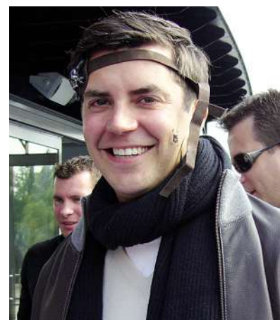
Ein Betriebsausflug im Sommer 2010 führte die Enders-Mannschaft unter dem Motto „Piraten“ auf große Rhein-Schiffahrt.