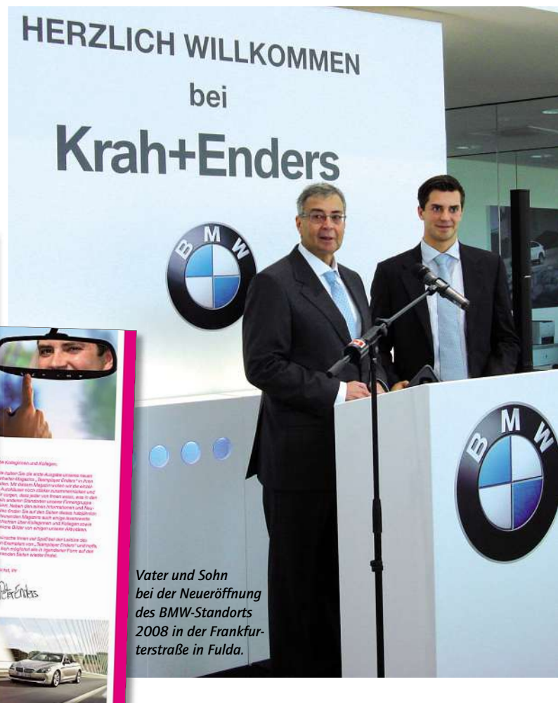
Vater und Sohn bei der Neueröffnung des BMW-Standorts 2008 in der Frankfurterstraße in Fulda.